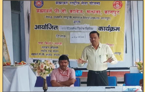
राष्ट्रीय सेवा योजना के विशेष शिविर के उद्घाटन सत्र को सम्बोधित करते प्राचार्य जी