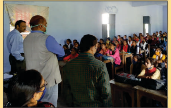
NEP-2020 के अन्तर्गत छात्र-अभिविन्यास कार्यक्रम