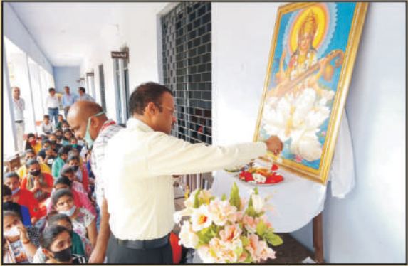
राष्ट्रीय सेवा योजना के विशेष शिविर के उद्घाटन सत्र का शुभारम्भ करते प्राचार्य जी